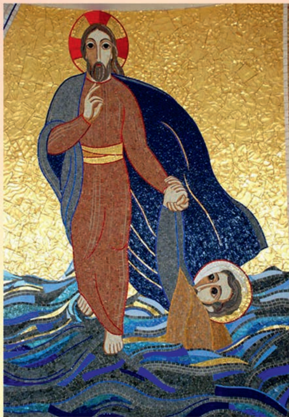
Jésus et Pierre sur le Lac (Centre Aletti)